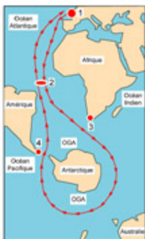
Le parcours du Vendée Globe (2)