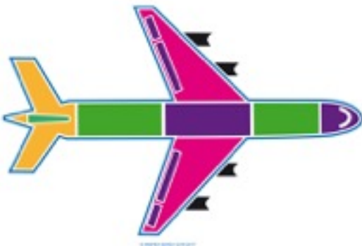
L'airbus 380 : un avion européen

Ils sont le plus souvent accompagnés d'un guide de lecture, texte destiné à aider le lecteur dans l'exploration de l'image en relief.