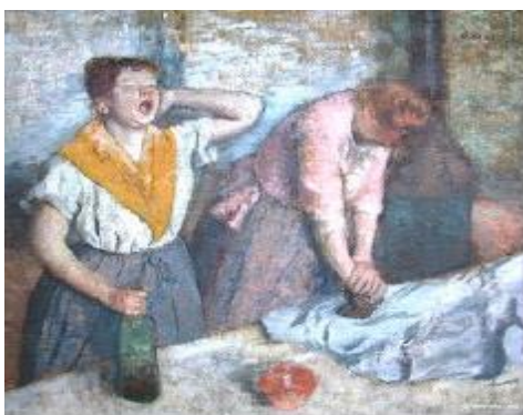
Edgar Degas - Les repasseuses

nouvelle génération . Sauront-ils repasser sans intervention humaine ?