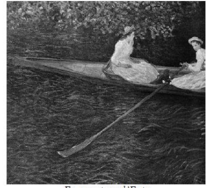
En canot sur l'Epte Claude Monet, 1887 ou 1890