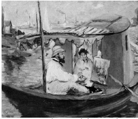
Monet et sa femme sur le bateau atelier Claude Monet, 1874