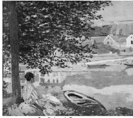
La Seine à Bemécourt Claude Monet, 1868