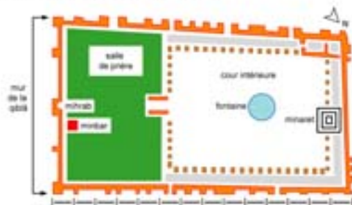
La grande mosquée de Kairouan (Tunisie)

Rubrique de la fiche SDADV: Histoire [2]