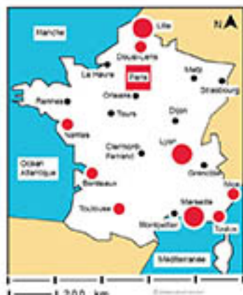
Les grandes agglomérations françaises en 2007

Sous-rubrique Niveau2: Espace métropolitain [4]