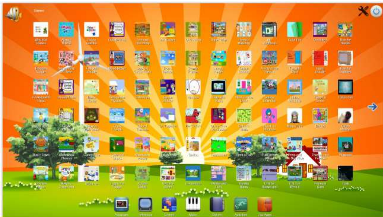
Figure 1 : écran montrant l'ergonomie de Zac Browser

ZAC Browser utilise des graphismes colorés et un environnement sonore agréable. Il propose une navigation sécurisée à la fois stimulante et ludique, totalement gratuite et facile à installer.