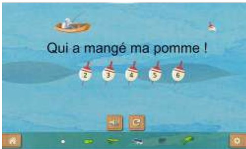
Figure 8 : Activité "Compter le nombre de phrases"

Bien souvent, les élèves confondent phrase et ligne. Il s'agit donc d'affiner la représentation de la phrase. Les deux signes permettant de la reconnaître sont le point et la majuscule. On introduit donc la majuscule comme marqueur de la phrase, mais il se peut qu'il y ait une majuscule au milieu d'une phrase. Dans cette activité existent plusieurs variables : phrases longues ou courtes et surtout, parfois des majuscules dans la phrase.