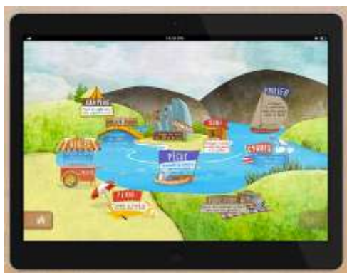
Figure 20 : Le graphisme a été très travaillé pour rendre l'application agréable aux élèves