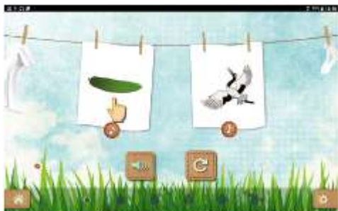
Figure 19 : Activité "Quantité d'oral/quantité d'écrit au niveau de mot"

Certains élèves pensent que plus un animal est gros, plus il y aura de lettres pour l'écrire. Leur représentation de l'écrit est encore basée sur la représentation visuelle. Or, le mot ours comporte bien moins de lettres que le mot papillon. C'est néanmoins le nombre de syllabes orales qui fait la longueur du mot. L'objectif est donc d'apprendre que plus il y a de syllabes orales dans un mot, plus il y a de lettres pour le transcrire.