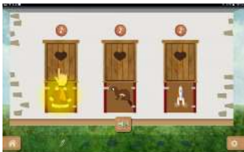
Figure 15 : Activité "Différencier les mots par leur son"

Après avoir éliminé les confusions entre sons proches, on proposera une activité de conscience phonologique au niveau du phonème (soit la plus petite unité sonore composant le mot). L'élève se détachera du sens du mot et le considèrera comme une suite de sons qu'il pourra ensuite transcrire par des lettres.