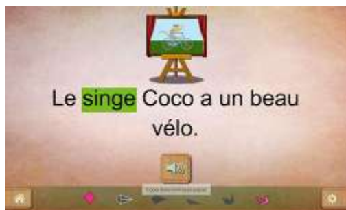
Figure 10 : Activité "Pointer le mot dans une phrase"

Cette activité est dans la continuité du sens de la lecture puisqu'il s'agit de réinvestir le balayage visuel, mais cette fois de façon plus fine puisque le texte est lu mot à mot. Les mots de la phrase qui sont lus sont surlignés, l'élève prend ainsi conscience qu'il existe un lien entre ce qui est écrit et ce qui est prononcé. Dans cette activité, il doit retrouver la position du mot dans la phrase.