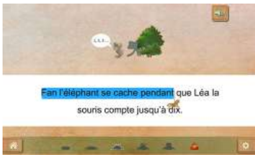
Figure 3 : Activité "S'orienter dans le sens de la lecture"

Lire de gauche à droite s'apprend. Certaines sociétés lisent dans d'autres sens influencées de haut en bas. Il est donc nécessaire d'apprendre à l'œil à balayer la page dans le sens nécessaire à la lecture du français. Pour certains élèves, cet apprentissage doit se faire de façon explicite, car on ne suit pas le mouvement des yeux d'un lecteur. Cette activité propose d'apprendre à l'élève le balayage visuel nécessaire à la lecture et les retours à la ligne. La voix qui lit au fur et à mesure permet de montrer que l'écrit est en lien avec l'oral. Les mots sont écrits dans l'ordre dans lequel ils sont dits. L'élève va commencer de façon implicite à comprendre le principe de la lecture de gauche à droite.