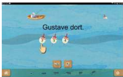
Figure 12 : Activité "Compter le nombre de mots dans une phrase"

L'élève doit apprendre à quoi « mot » fait référence. C'est un terme souvent employé qui fait partie du vocabulaire courant. Il doit donc être appris afin que la