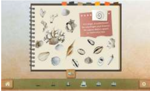
Figure 2 : Activité "Trouver de l'écrit dans une page"

Dans cette activité, l'élève va devoir retrouver les éléments textuels dans un environnement graphique de plus en plus riche et complexe. Dans les niveaux proposés, les textes peuvent être à côté des dessins, mais aussi insérés dans l'image globale.