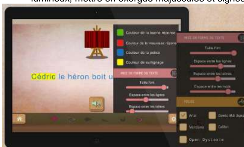
Figure 22 : il est possible d'adapter la mise en forme à chaque élève