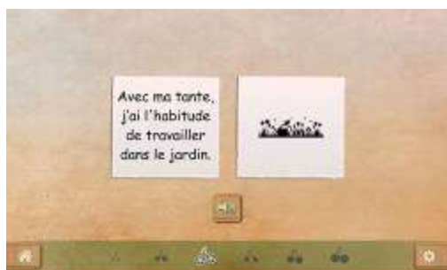
Figure 1 : Activité "Faire la différence entre le dessin et l'écrit"

Il est important que, très tôt, l'élève fasse la différence entre le dessin et les lettres afin de se construire une représentation efficace du système alphabétique. En lui demandant de distinguer le texte du dessin, cette activité va aider l'élève à construire cette représentation claire des signes de l'écrit. Plusieurs variables sont proposées afin que cette distinction repose sur des critères solides. Par exemple : l'écrit en noir et les dessins en couleurs. Dans cette activité, les lettres peuvent être en noir sur fond blanc, mais aussi en couleurs.