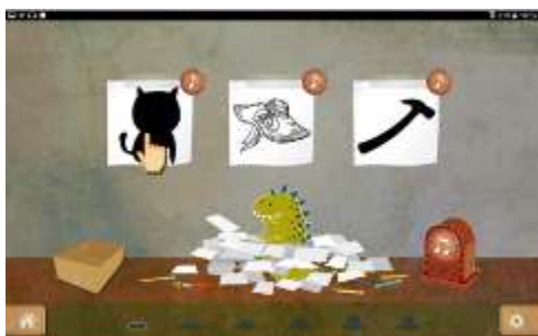
Figure 16 : Activité "Dénombrer les syllabes d'un mot/faux mot"

Il s'agit de permettre à l'élève de considérer les mots pour leur sonorité au niveau de la syllabe. Les faux mots ou logatomes permettent à certains élèves d'accéder à cette compétence. En effet, il peut être très difficile pour certains de couper le mot « gâteau » en 2 morceaux « gâ »/ « teau », alors que dans leur esprit, ils « voient » le gâteau en entier et n'ont aucune envie de le couper. Dans cette activité, l'élève doit donc reconnaître les mots d'une, de deux ou de trois syllabes.