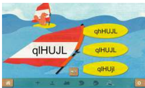
Figure 5 : Activité "Distinguer les suites de formes et de lettres"

Dans cette activité, nous demandons à l'élève d'indiquer si une suite de lettres est identique ou non à une autre suite de lettres, ce qui stimule également la mémoire de travail qui sera nécessaire dans l'apprentissage de la lecture et la mémorisation de l'orthographe des mots.