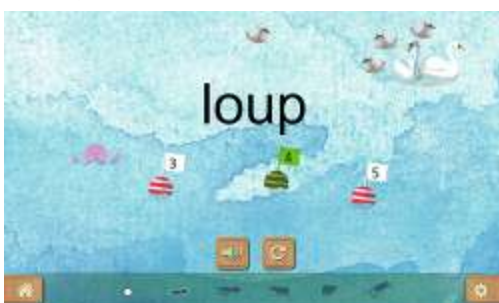
Figure 9 : Activité « Compter le nombre de lettres dans un mot »

Cette activité va permettre à l'élève d'apprendre explicitement à quoi le mot « lettre » fait référence. Dans cette activité, l'élève est amené à prendre conscience qu'un mot est composé de plusieurs lettres et que leur nombre varie d'un mot à l'autre.