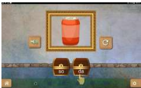
Figure 17 : Activité "Localiser une syllabe dans un mot/faux mot"

Développer la conscience phonologique est nécessaire pour comprendre le fonctionnement du code écrit. Une fois que l'élève sait repérer si une syllabe est présente dans un mot, on ajoute une compétence supplémentaire à savoir la place de cette syllabe en début ou en fin de mot, voire au milieu du mot. Il s'agit de lui faire