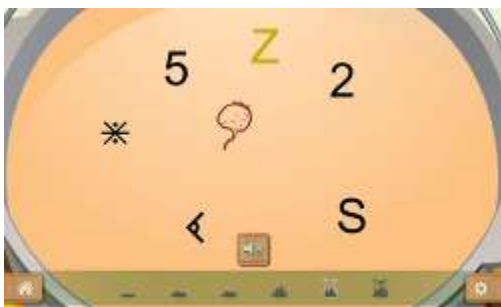
Figure 4 : Activité "Distinguer les lettres des autres signes"