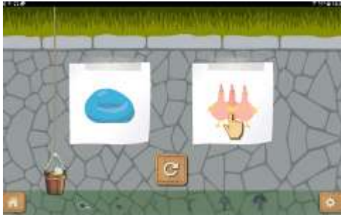
Figure 13 : Activité "Faire la différence entre des sons proches"

Discriminer les sons de la langue pour pouvoir ensuite les écrire est incontournable. En effet, comment écrire le son « d » si je ne le distingue pas du son « b ». Or, certains élèves confondent des sons proches. Il s'agit alors d'exercer l'oreille des élèves à l'analyse des sons ; non pas en leur demandant si tel mot commence par un « b » ou un « d » car ils n'ont pas encore la compétence nécessaire, mais en leur demandant quel est le mot prononcé.