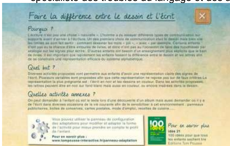
Figure 21 : Des fiches expliquent aux adultes l'intérêt de chaque exercice