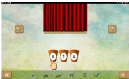
Figure 18 : Activité "Compter le nombre de mots dans une phrase"

La notion de mot est une notion en référence à l'écrit actuel. À l'oral, le mot n'existe pas. On ne s'arrête pas entre chaque mot quand on parle. Les élèves doivent apprendre cette notion ici de façon implicite. Grâce aux pictogrammes (un pictogramme pour un mot), l'élève va apprendre la notion de mot. Les « mots outils » sont écrits, ce qui va lui permettre d'enrichir son stock orthographique.