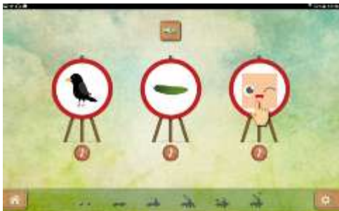
Figure 14 : Activité "Repérer les syllabes identiques dans des mots"

Développer la conscience phonologique au niveau de la syllabe est fondamental. Savoir si on entend la même syllabe dans des mots différents permet à l'élève de prendre conscience que les mots sont parfois constitués de syllabes identiques. Ici, il s'agit de comparer des mots syllabe par syllabe et de trouver le mot qui ne contient pas la syllabe indiquée. La notion d'intrus peut être compliquée au début mais elle participe à l'entraînement à la catégorisation.