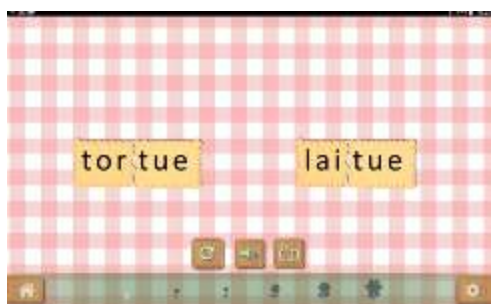
Figure 11 : Activité "Reconnaître visuellement une syllabe identique dans deux mots"

Lire, c'est faire le lien entre des signes abstraits, arbitraires (graphèmes) qui, par convention, symbolisent des sons (phonèmes). Ces signes sont en nombre limité. Les élèves n'imaginent pas que des groupes de lettres identiques peuvent se retrouver dans des mots très différents. Il s'agit d'attirer le regard de l'élève sur l'écriture des mots. Il n'est pas question de faire lire mais d'analyser visuellement les mots et de remarquer la syllabe identique.