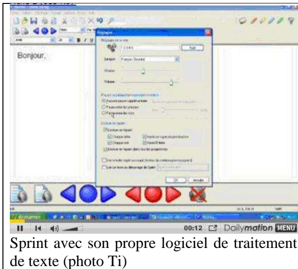
Sprint avec son propre logiciel de traitement de texte