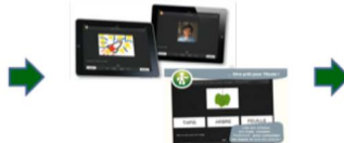
Des applications sur tablettes tactiles en lien avec le Socle commun de connaissances et de compétences