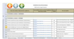
Un fichier référentiel pour préparer les activités de la classe