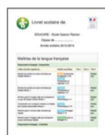
Les Livrets scolaires adaptés générés automatiquement