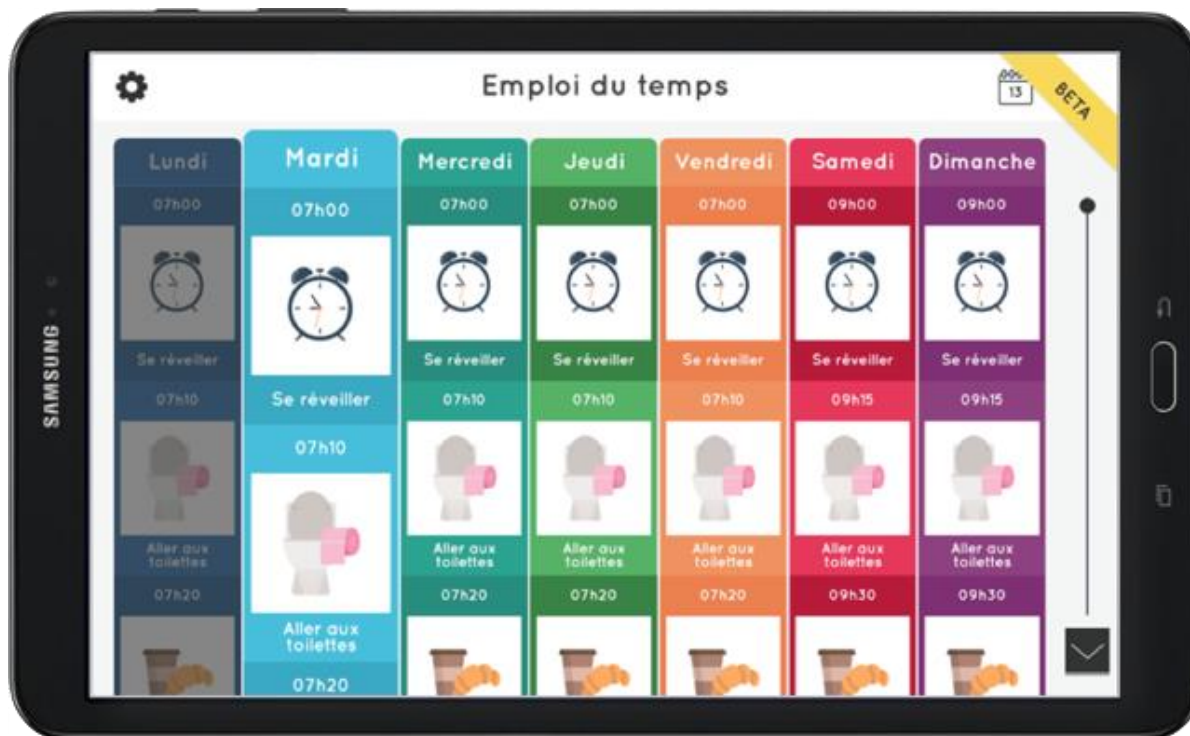
Vue hebdomadaire de l'emploi du temps

Note : le code couleur permet de différencier les jours de la semaine. La journée est également structurée autour de 5 « moments » , mis en valeur avec des couleurs et des pictogrammes (matin, midi, après-midi, soir, nuit).