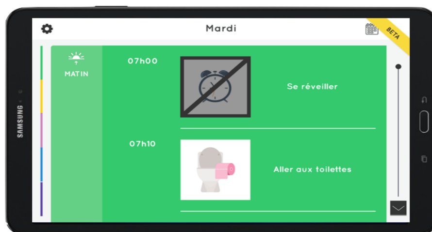
Vue Jour de l'application AGENDA

La possibilité de configurer plusieurs options afin de laisser à l'élève le choix entre deux activités à un moment donné sera bientôt disponible. De la même manière, une fonctionnalité de rappel des événements sera très prochainement disponible. Les activités sont programmées comme ponctuelles ou récurrentes comme le repas.