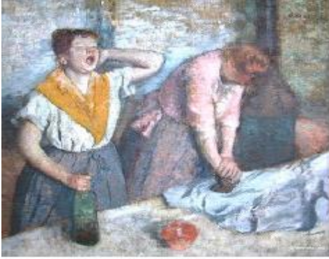
Edgar Degas - Les repasseuses