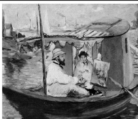
Monet et sa femme sur le bateau atelier Claude Monet, 1874

Une barque sur l'eau calme... Le long de la rive quelques arbres au feuillage rafraîchissant ... Camille rêve.