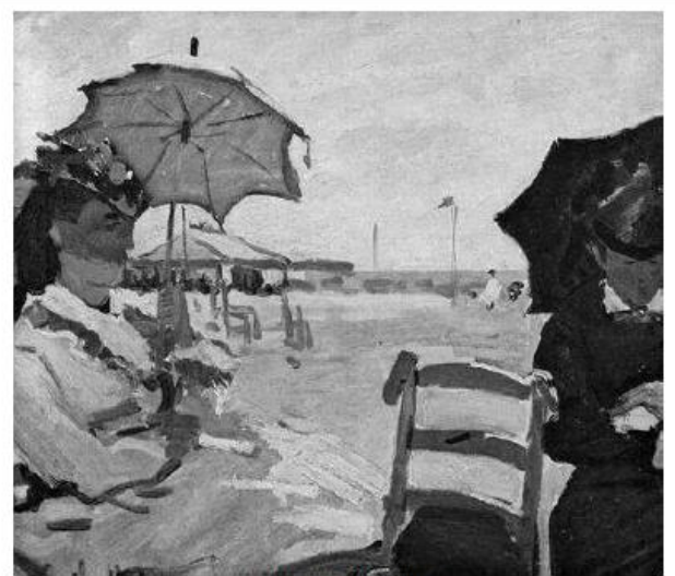
La plage à Trouville Claude Monet