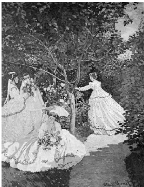
Femmes au jardin à Ville-d'Avray, Claude Monet