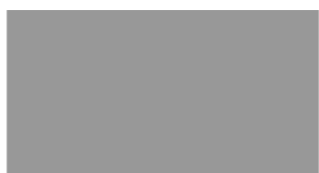
image 2: Une peau d'écaille d'un bulbe d'oignon observée au microscope

image 1: Une cellule de peau d'écaille d'un bulbe d'oignon observée au microscope (taille: ` 0,10 mm)